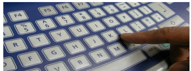
本体一体型のキーパッド (防塵・防滴タイプ)