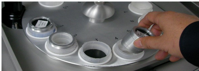
サンプルトレーが標準装備